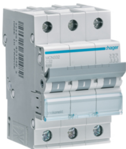
Jistič 3 pól. 32A, char.C, 6 kA