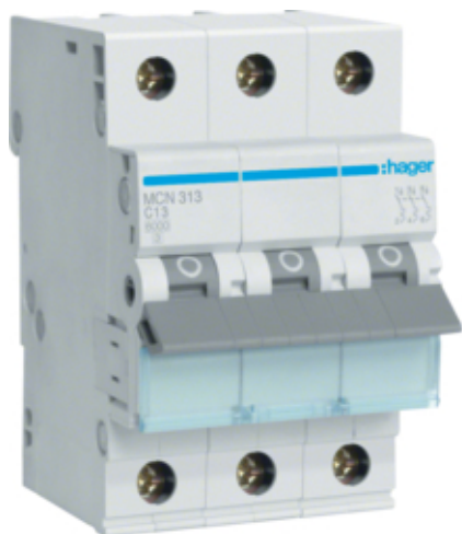
Jistič 3 pól. 13A, char.C, 6 kA